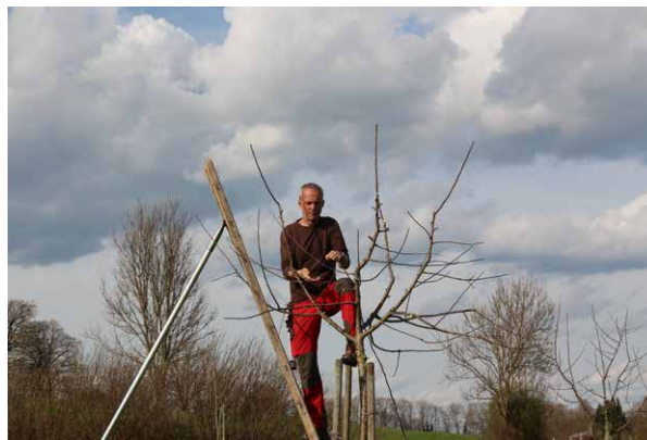
Abb. 4: Auch Formierungsarbeiten im Zuge des Aufbauschnitts (Erziehungsschnitt) sind Bestandteil der Standards

Es ist vorab ein Kronenmodell festzulegen, nach dem die Krone gestaltet wird.“