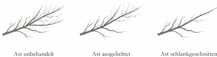
Abb. 7-9: Die Schnittmaßnahme des Schlankschnitts als besondere Form der Kronenauslichtung ist Bestandteil einer fachgerechten Pflege

Ein weiterer Nutzen ist in der fachlichen Vertiefung zu sehen, die einige zentrale Fragen der Pflege durch intensive Diskussionen in der Arbeitsgruppe und im Diskurs mit dem Expertenkreis erfahren haben. Man wird in der gängigen Fachliteratur dazu in Teilen nur wenig finden. Das betrifft grundlegende Fragen zur Abschottungsfähigkeit ebenso wie beispielsweise solche zum Schnittzeitpunkt, zu Schnittmaßnahmen oder zum Thema der Eingriffsstärke. Einen breiten Raum nimmt die Beurteilung der Vitalität im Rahmen der Baumansprache ein. Auch die Bedeutung der Blattmasse und das Aststärkenverhältnis innerhalb einer hierarchisch strukturierten Krone wird hervorgehoben und bildet einen wesentlichen Faktor einer fachgerechten Pflege. Es wurde daher dem normativen Teil – den eigentlichen Standards – ein erläuternder, rein informativer Anhang beigelegt, der die formulierten Anforderungen erläutert und begründet.