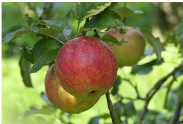
Abbildungen 3: 'Schöner aus Kent'

Die Sorte 'Beauty of Kent' ('Schöner aus Kent') war in Deutschland pomologisch nicht mehr nachweisbar. Bei der DGO-Prüfung konnte sie anhand von historischer Literatur bestimmt werden. Der entscheidende Hinweis kam von der Bezeichnung 'Britzer Dauerapfel' in einem anderen DGO-Sortengarten. In Deutschland wurde die Sorte unter diesem Namen von der Baumschule Späth verbreitet. Unter der Bezeichnung 'Apfel aus Grignon' wurde sie zuvor am KOB geführt. Insgesamt wurden für diese Sorte in der europäischen Fingerprint-Datenbank mehr als 30 verschiedene Namen erfasst. Sie ist nicht nur in England verbreitet, sondern auch in der Schweiz, Frankreich und Italien.