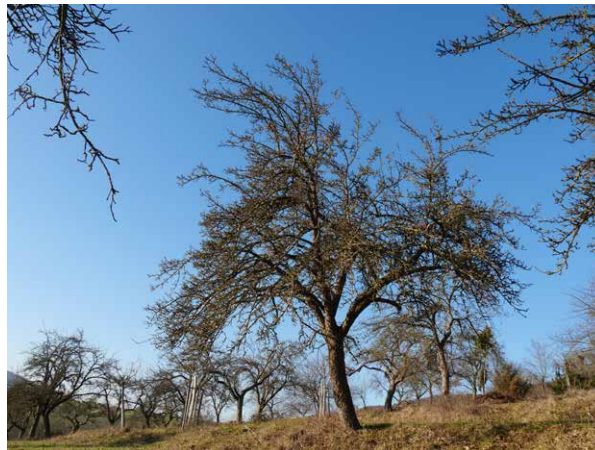
Abb. 5: Apfelbaum mit dem Vitalitätszustand RS -1; seine Regenerationsfähigkeit ist unsicher; es ist mit geringer Stärke eingzugreifen (max. 15% Blattmasseentnahme, max. 5 cm Wundgröße); s. dazu auch Tab.1