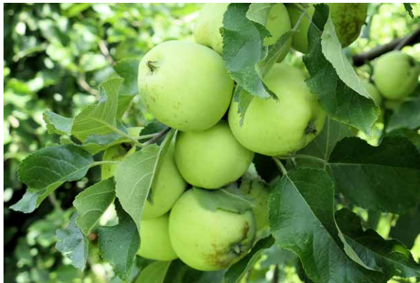
Abbildung 6 und 7: 'Salome' und 'Lodi'