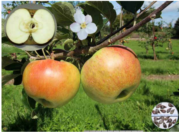
Abbildungen 1+2: 'Oberländer Himbeerapfel' und 'Raafs Liebling'

Die Sorte 'Raafs Liebling' wurde in den 1930-iger Jahren nach der Baumschule Raaf in Nagold benannt. Sie ist aber weitaus älter und nicht nur in Deutschland, sondern international verbreitet. Der ursprüngliche Name ist nicht mehr bekannt. Weitere Benennungen sind 'Später Transparent', 'Falscher Teuringer', 'Pollinger Klosterapfel' oder 'Ludwigsburger'. In Skandinavien ist die Sorte unter dem Namen 'Husmoder' (Hausmutter) beschrieben. Die triploide Sorte ähnelt dem 'Rheinischen Winterrambur' und scheint mit ihm verwandt zu sein. Sie wächst stark und ist wenig anfällig für Schorf und Mehltau.