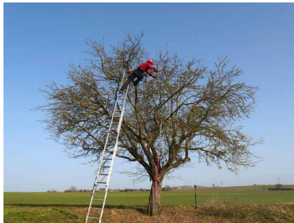
Abb. 1: Häufig im Rahmen einer fachgerechten Pflege von Altbäumen durchgeführt - die baumschonende Bearbeitung der Kronenperipherie

Nun liegt erstmalig eine Veröffentlichung vor, die Grundsätze fachgerechten Arbeitens an großkronigen Obstbäumen formuliert. Ausschreibende Stellen haben damit die Möglichkeit, Leistungen der Obstbaumpflege vergleichbar auszuschreiben und abzunehmen. In der Obstbaumpflege geschulte Baumpfleger*innen können nun ihre Qualifikation bei Ausschreibungen geltend machen bzw. erhalten einen Anreiz, sich in diesem Bereich der Baumpflege fortzubilden.