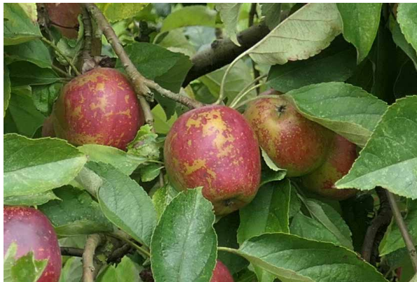
Abbildungen 4 und 5: ‚Birnförmiger Apfel‘ und ‚Leckerbissen‘